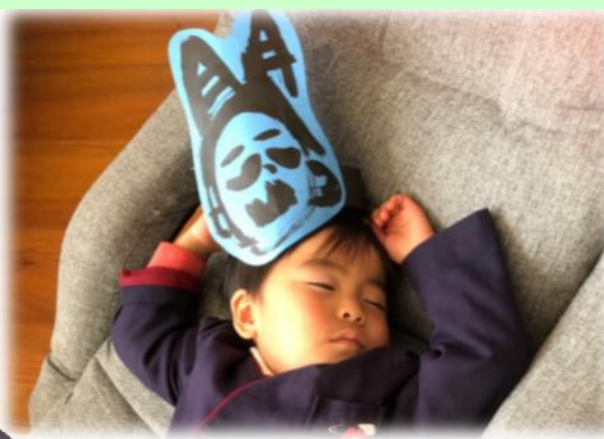
第3回名田島人権フォトコンテスト最優秀賞 テーマ「しあわせ」