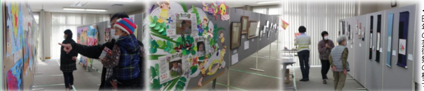
◀ 昨年の芸術祭の様子

※上映会場につきましては、部屋を開放して映像をプロジェクターでスクリーンに投影します。