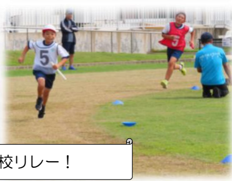
白熱の全校リレー！

10月6日（日）に名田島小学校芝生グラウンドの冬芝の種まきが、しばもり隊を中心とした地域の方々によって行われました。皆さま、大変お疲れ様でした。いつも綺麗な芝生のお手入れ、ありがとうございます。（※冬芝養生期間のためグラウンド開放は10月26日（土）まで休止となります。）