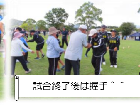
試合終了後は握手^^