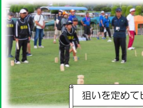
狙いを定めてピンナを投げます！

9月29日（日）、山口市ニュースポーツ地域対抗交流大会が開催されました。今回の競技種目はクップで、名田島からは6名の方が出場しました！出場された選手の皆さま、暑い中お疲れ様でした。