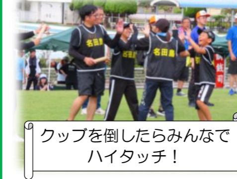
クップを倒したらみんなでハイタッチ！