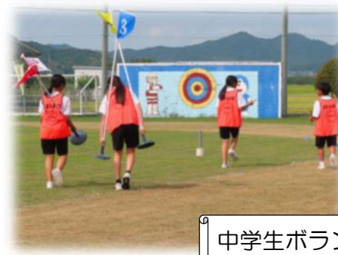
中学生ボランティアも大活躍！