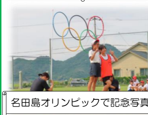
名田島オリンピックで記念写真♪