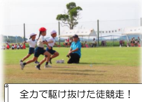
全力で駆け抜けた徒競走！

9月28日（土）、名田島小学校で秋季大運動会が開催されました。徒競走や名田島ソーランなど、子どもたちは日々の練習の成果を発揮し、「30人で協力し最後までみんなが輝く運動会」のスローガンのとおり、一人一人の活躍が輝く運動会でした！暑い中、皆さまお疲れ様でした。なお、秋の運動会は今年で最後となり、来年からは、春に地域の運動会と合同開催の予定です。