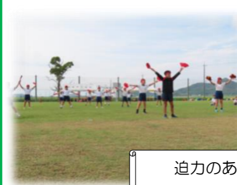
迫力のある応援合戦！