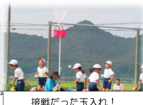
接戦だった玉入れ！