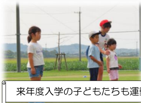
来年度入学の子どもたちも運動会に参加♪